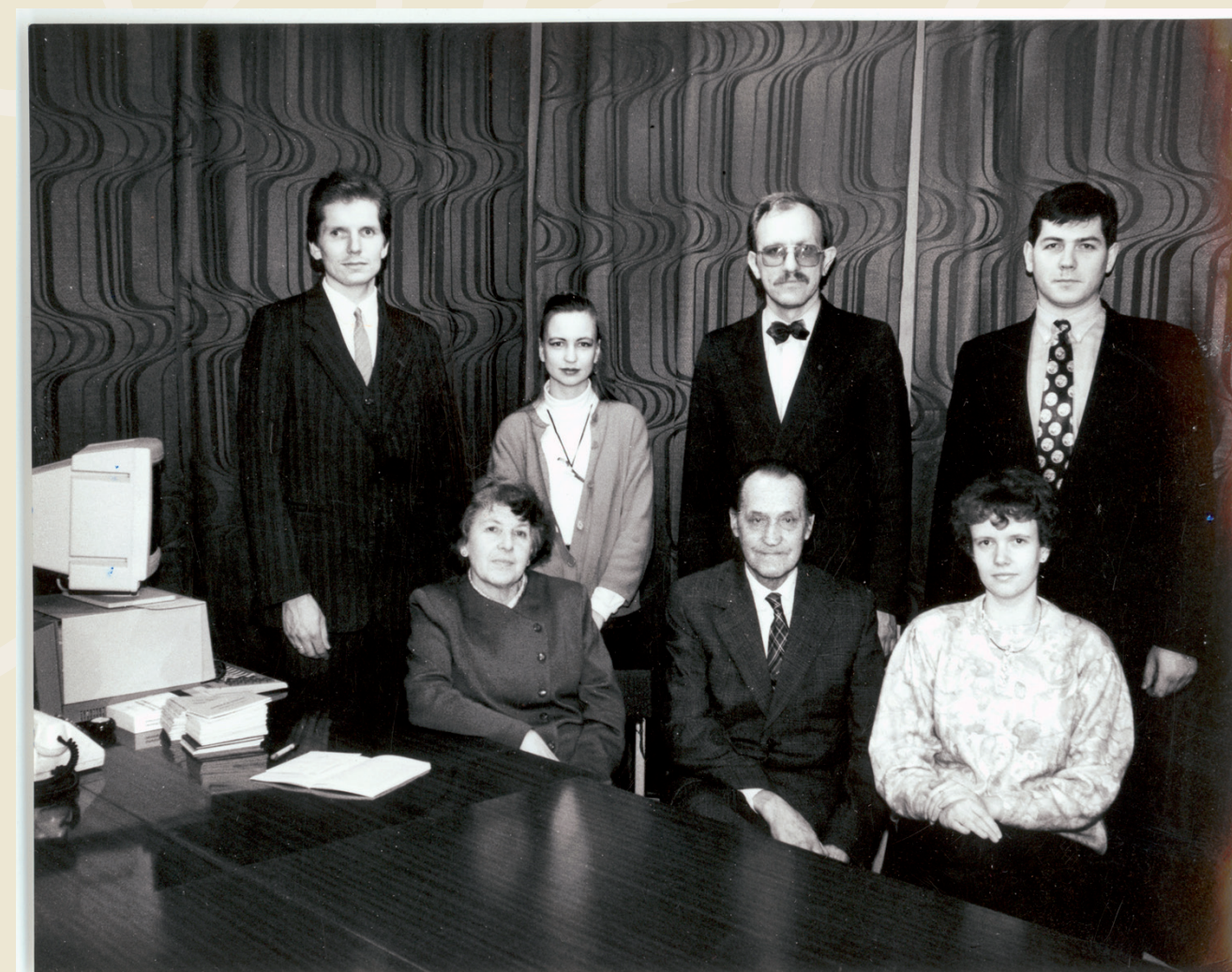
Eesti õiguse ajaloo õppetool 1993. a.