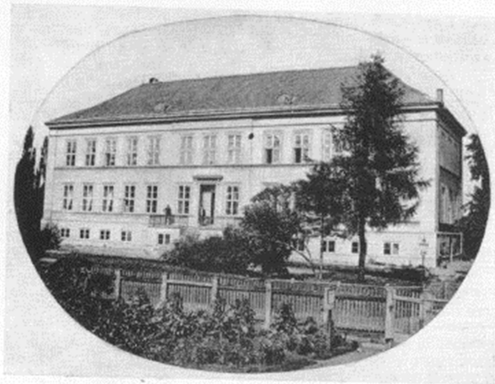
K.E. v. Baeri sünnikoht – Piibe mõis Birthplace of K.E. v. Baer – Piibe Estate