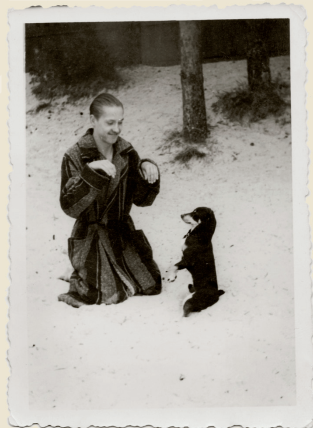
Noorukina Narva-Jõesuu rannas