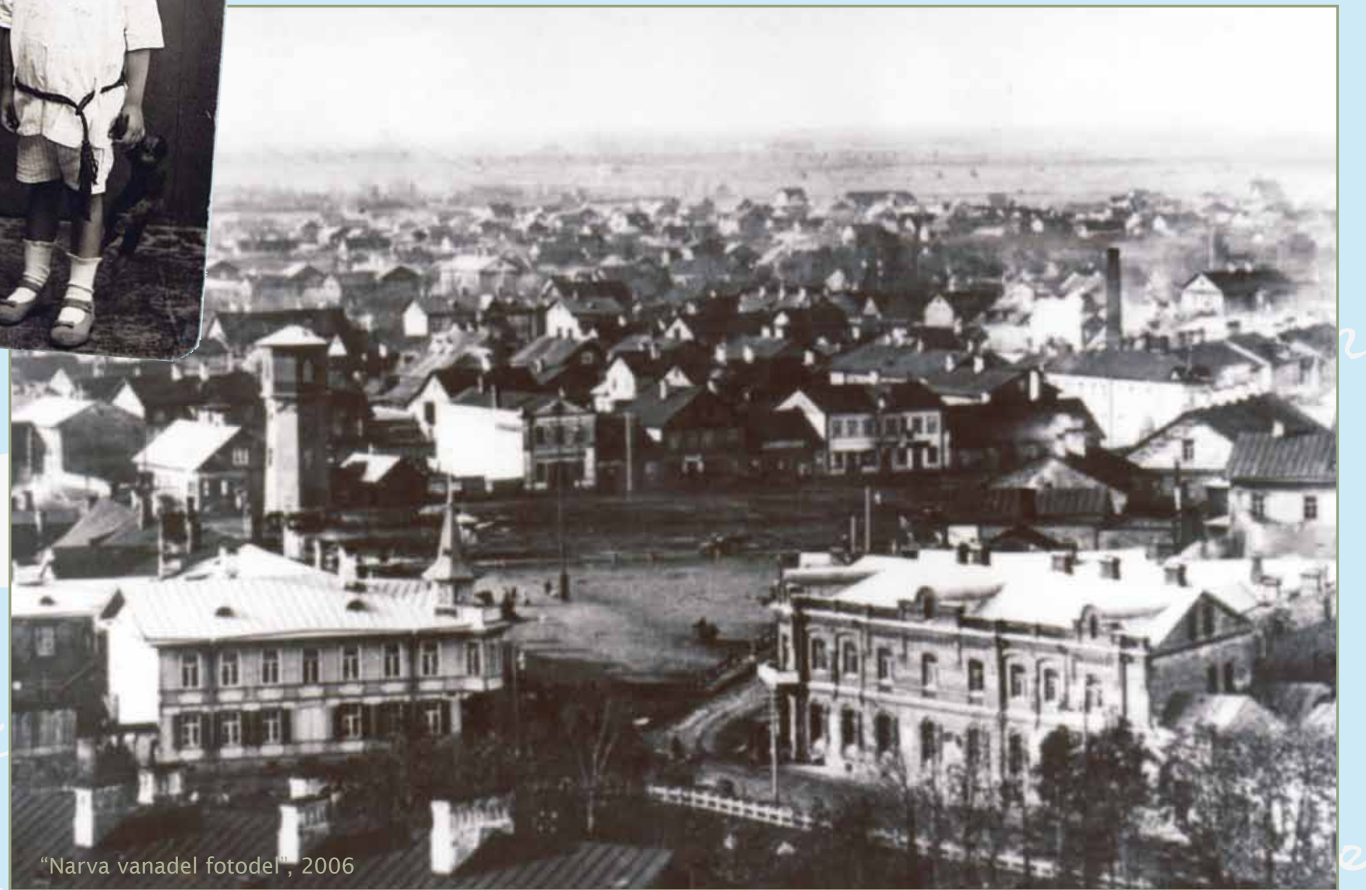
"Narva vanadel fotodel", 2006