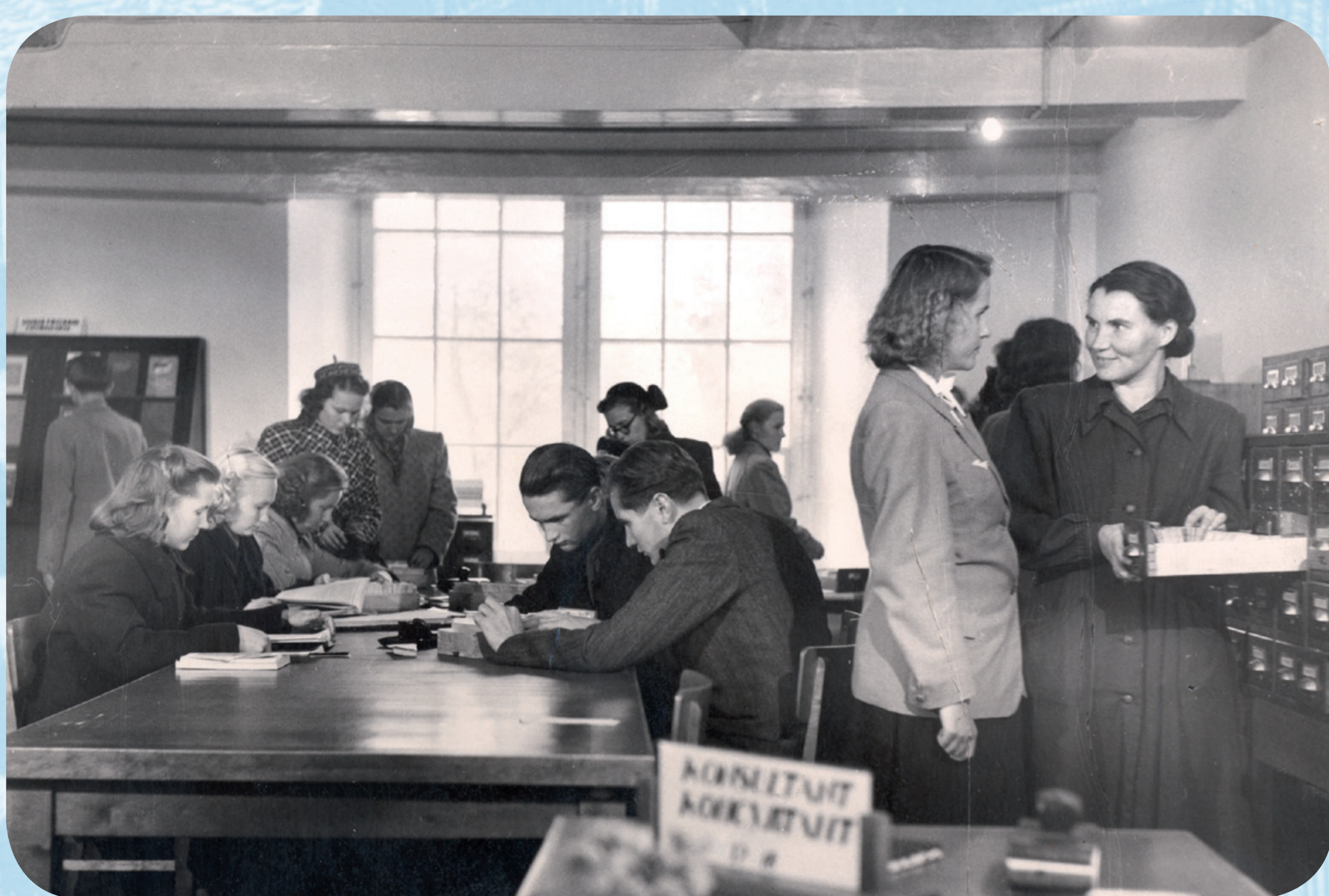
Katoloogikonsultandina 1952. a