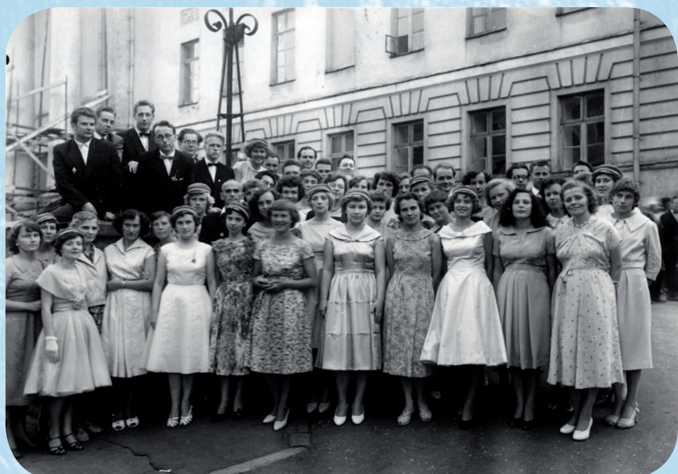
Koos raamatukogunduse eriala üliõpilastega pärast lõpuaktust peahoone ees 1960. a ...