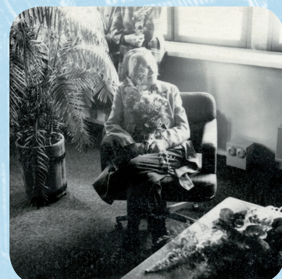
28. septembril 1990 direktori kabinetis