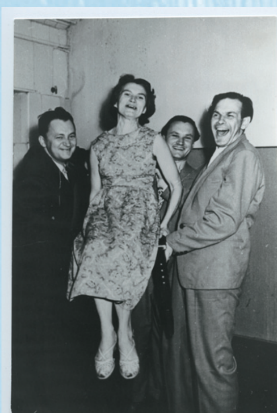
... ja lõpuõhtul