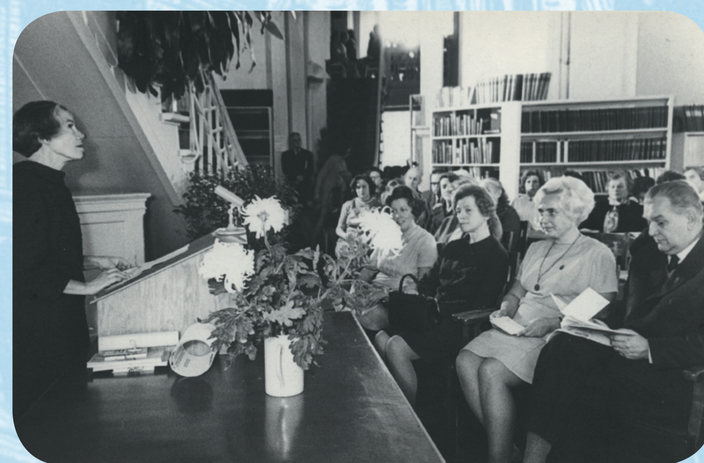
Karl Mogensterni 200. sünniaastapäevale pühendatud teaduskonverents 1970