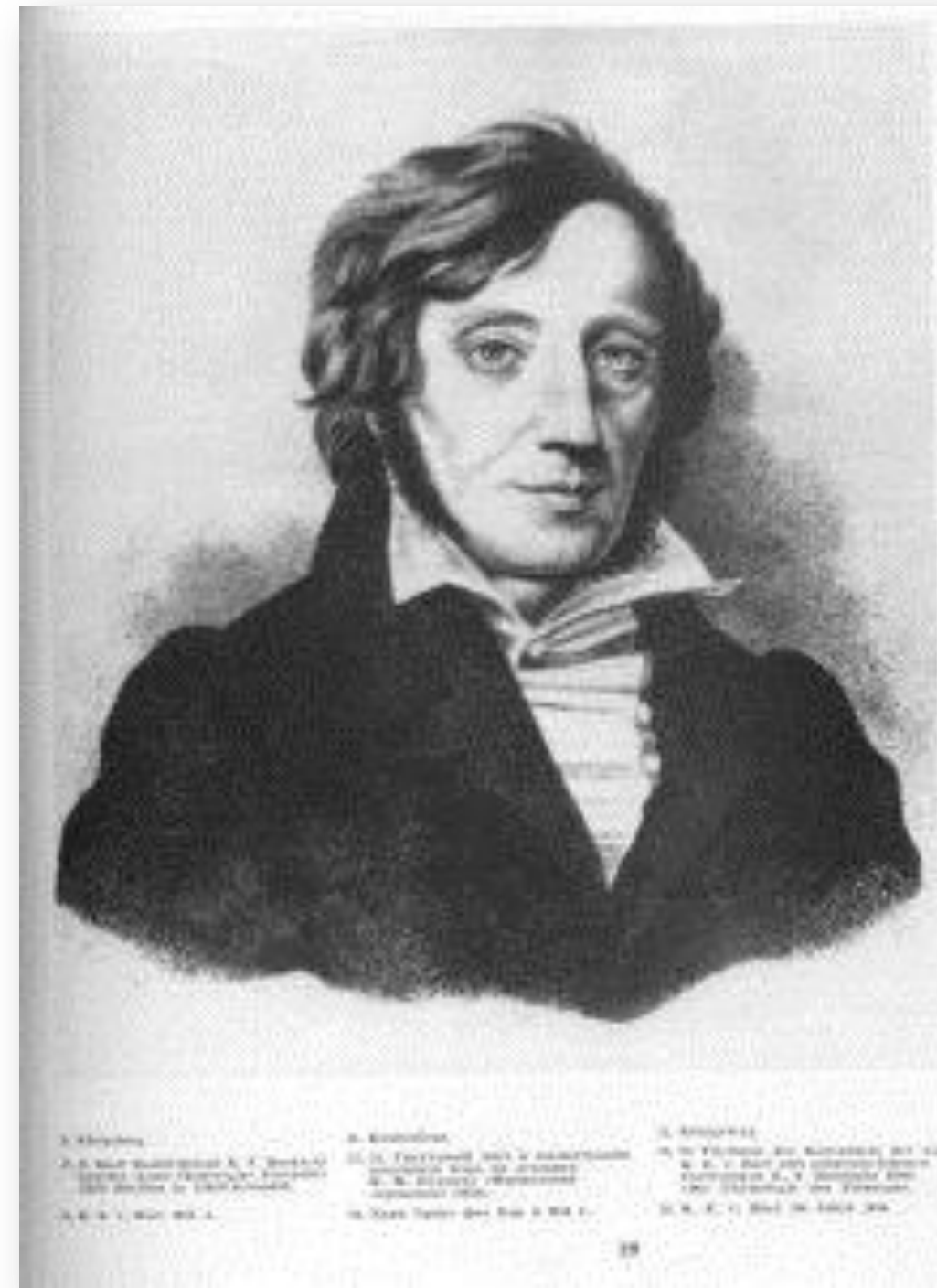
K.E. v. Baer 1834. aastal K.E. v. Baer in 1834